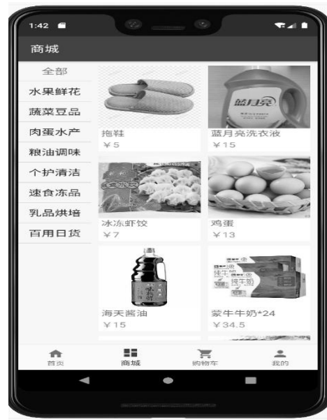
图 7 农产品管理界面

商家在后台上架农产品,用户在使用移动端时,可以查看并购买农产品,商家可以查询、上架、下架、新增和删除农产品。用户查看农产品的界面如图 7 所示。