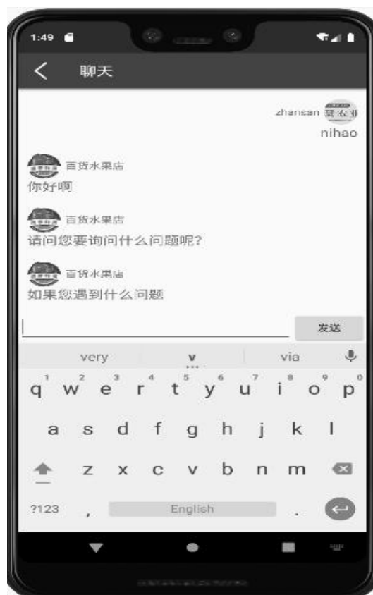
图 4 客服聊天界面

的时候, 商家那边就会收到用户发送过来的信息, 商家就可以根据用户所提出的问题进行解答, 客服聊天界面如图 4 所示。