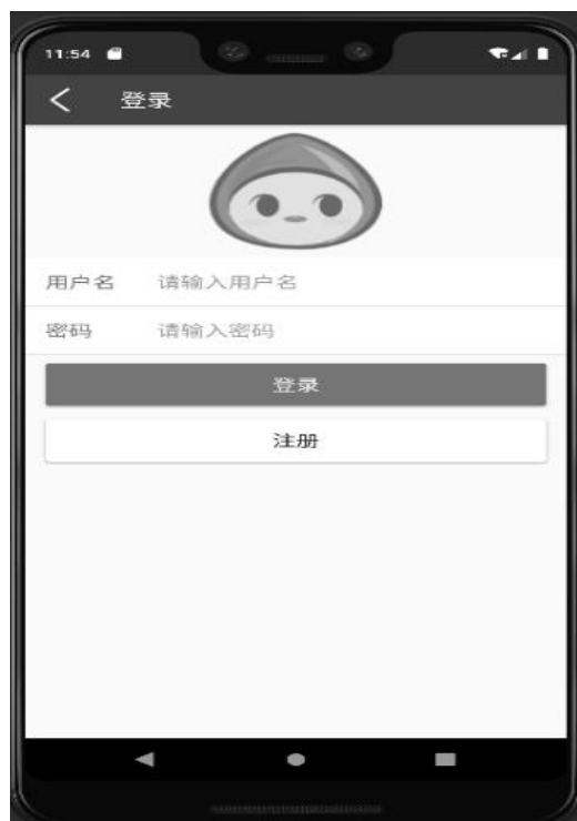
图 2 用户登录页面

后台登陆分为商家登陆和管理员登陆,当输入用户名、密码以及验证码时,如有一项与之不匹配,则登陆失败,如果是用户名和密码有一项不匹配,则会提示“用户名或密码错误”,如是验证码错误,则会提示“验证码错误”,如果用户名、密码、以及验证码输入正确,登陆身份错误时,也会提示“用户类型不对”,反之,登陆成功,进入到后台管理页面,登录界面如图 2 所示。