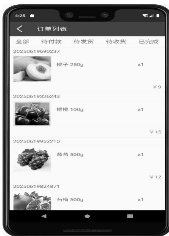
图 3 用户订单界面

商家可以在后台的订单管理模块查看农产品销售的订单详情, 并改变订单状态。顾客用户可以在订单列表中查看订单的具体情况, 未付款订单可以取消。用户订单列表查看的订单如图 3 所示。