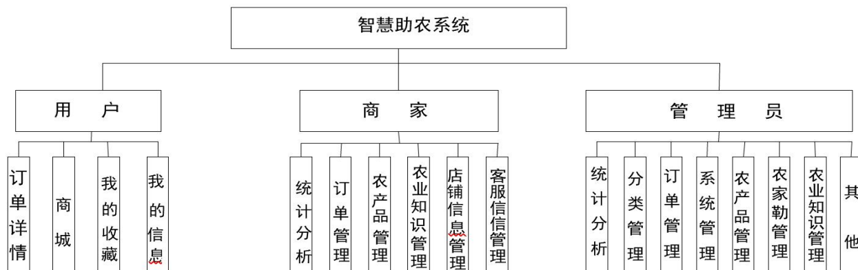
图 1 功能结构图

分析、订单管理、农产品管理、店铺信息管理、客服 信息管理等功能,功能结构如图 1 所示。