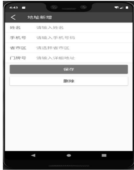
图 6 收货地址界面

在用户进行商品购买的过程中,系统会弹出一个选择收货地址的页面。用户可以设置新的收货地址,或者对已存在的收货地址进行修改、删除操作。收货地址的具体信息涵盖了姓名、手机号码、省市区信息以及详细的门牌号,收货地址界面如图 6 所示。